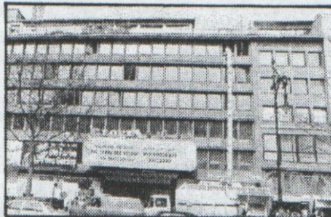
Auf dem Dach des „Gloria“-Hauses entsteht mit herrlichem Blick auf die City das neue Café „Pientka“, in den vier Stockwerken darunter das gleichnamige Hotel mit 57 Zimmern

bars und für jeden Gast extra programmierte Computercode-Karten statt Schlüsseln für die Zimmertüren. Café- und Hotel-Chef Georg Pientka (38) zu BILD-Berlin: „Ende Mai soll alles fertig sein – zur Funkausstellung im August sind wir schon ausgebucht.“ VG